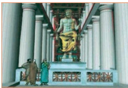
Αξονική άποψη του αγάλματος του Δία